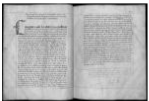
P. 37 F. 19