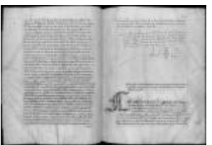
P. 45 F. 23