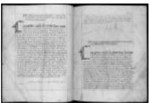
P. 39 F. 20