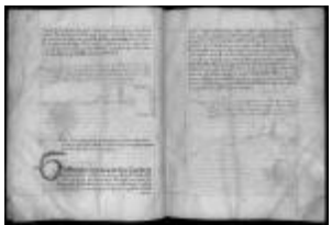
P. 25 F. 13