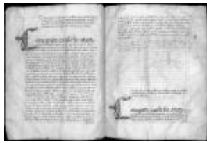
P. 17 F. 9