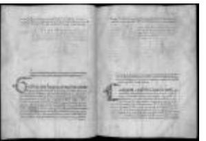
P. 29 F. 15