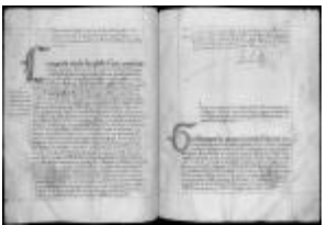
P. 27 F. 14