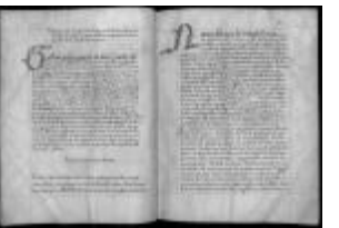
P. 33 F. 17