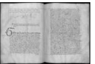
P. 51 F. 26