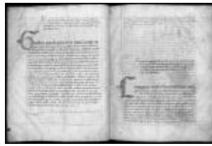
P. 21 F. 11