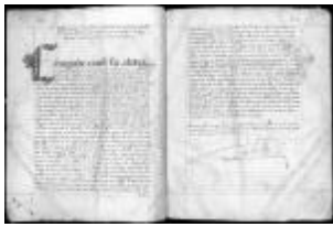
P. 15 F. 8

Ce manuscrit est orné d'initiales à cadeaux : les traits réalisés à la plume forment ou prolongent certaines parties d'une lettre.