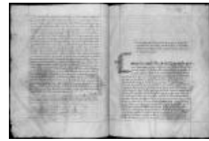
P. 23 F. 12