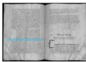
MS 1AA1P.125 - F.63

Longtemps considéré comme le plus vieux document rédigé en gascon, le texte des Coutumes de Corneillan , dans le département du Gers (1142-1143), suit de près le cartulaire de Bigorre. Composé dans une langue où apparaissent la