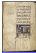
MS 0042P.34 - F.14