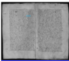
MS 0363P.23 - F.12

De ce fait, les manuscrits médiévaux parlent tantôt de « Guyenne », tantôt de « Gascogne », mais aussi « d'Aquitaine », dont le concept remonte à l'Antiquité. À l'exergue des lettres royales, il est par exemple spécifié que le souverain anglais est « per la gracia de Diu, rey de Anglaterra, Seynhor de Yrlanda, duc de Normandia et de Aquitania, Compte d'Anyo... », avec des variantes graphiques mais une grande constance dans la mention de l'immense fief apporté en dot, jadis, par la reine Aliénor « d'Aquitaine ».