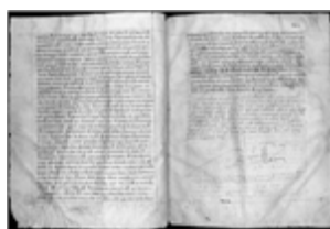
MS 1AA1P.13 - F.7

En Gascogne, Jaufrè Rudel, comte de Blaye (1113-1170), chante l'amor de luenh , l'histoire d'amours impossibles avec Hodièrne, princesse de Tripoli, alors même que Marcabru et Cercamont innovent en créant des chansons complexes, notamment le modèle de la cançon clusa . En Périgord, Bertran de Born (1140-1215), se distingue par une œuvre partagée entre la glorification de l'amour et de la guerre, en grande partie constituée de sirventes , poèmes satiriques s'attaquant aux institutions, tandis qu'Arnaud Daniel, de Ribérac, crée une poésie très recherchée, la sextine, que l'on retrouve dans la Divine Comédie de Dante.