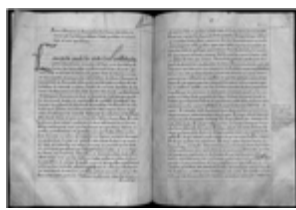
MS 1AA1P.141 - F.71

Des spécificités du béarnais apparaissent clairement dans ce que l'on appelle la scripta béarnaise. Cette langue archaïque, bien que compréhensible pour un locuteur actuel, proche de la koinè occitane des troubadours, se retrouve dans le cartulaire d'Oloron.