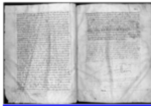
MS 1AA1P.13 - F.7

En Gascogne, Jaufrè Rudel, comte de Blaye (1113-1170), chante l'amor de luenh , l'histoire d'amours impossibles avec Hodièrne, princesse de Tripoli, alors même que Marcabru et Cercamont innovent en créant des chansons complexes, notamment le modèle de la cançon clusa . En Périgord, Bertran de Born (1140-1215), se distingue par une œuvre partagée entre la glorification de l'amour et de la guerre, en grande partie constituée de sirventes , poèmes satiriques s'attaquant aux institutions, tandis qu'Arnaud Daniel, de Ribérac, crée une poésie très recherchée, la sextine, que l'on retrouve dans la Divine Comédie de Dante.