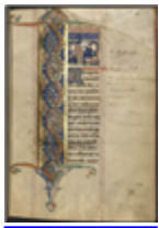
MS 0042P.33 - F.14

Ces partages ne sont pas étrangers à la répartition et à l'évolution des langues que l'on retrouve dans les manuscrits des Archives de la Gironde ; tenir compte de ces aléas de l'Histoire permet de saisir pourquoi, par exemple, la Coutume d'Agen est rédigée en languedocien et les autres documents en gascon. Considérer ces faits, c'est enfin comprendre pourquoi l'histoire de l'Aquitaine s'est écrite, jusqu'au XVIe siècle, dans une autre langue que le français ; toponymes et patronymes sont bien là, au quotidien et dans les textes, pour nous le rappeler.