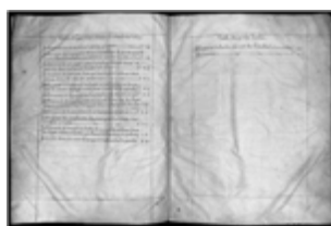
MS 1AA1P.7 - F.4

À l'exception de ce document énigmatique, on reconnaît que les premiers textes connus en ancien occitan sont la Chanson de sainte Foy (VIIIe-IXe siècles), qui conte l'histoire d'une jeune Agenaise martyrisée sous Dioclétien, et le poème sur Boèce inspiré du De Philosophiae Consolatione (début XIe siècle), rédigé en dialecte limousin par un auteur inconnu. Mais c'est avec Guillaume de Poitiers (1071-1126), grand-père d'Aliénor d'Aquitaine, que naît la littérature occitane. On considère en effet celui-ci comme le premier trobador : c'est lui qui fixe les règles du trobar , de la « composition », de la « création » et invente le concept de fin'amor , d'amour courtois.