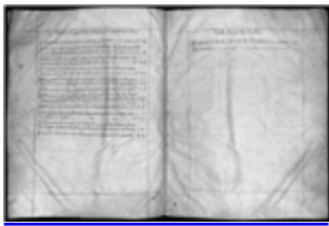
MS 1AA1P.7 - F.4

À l'exception de ce document énigmatique, on reconnaît que les premiers textes connus en ancien occitan sont la Chanson de sainte Foy (VIIIe-IXe siècles), qui conte l'histoire d'une jeune Agenaise martyrisée sous Dioclétien, et le poème sur Boèce inspiré du De Philosophiae Consolatione (début XIe siècle), rédigé en dialecte limousin par un auteur inconnu. Mais c'est avec Guillaume de Poitiers (1071-1126), grand-père d'Aliénor d'Aquitaine, que naît la littérature occitane. On considère en effet celui-ci comme le premier trobador : c'est lui qui fixe les règles du trobar , de la « composition », de la « création » et invente le concept de fin'amor , d'amour courtois.