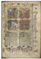
MS 0730P.11 - F.6

Les manuscrits médiévaux témoignent de pratiques musicales dans un contexte essentiellement religieux. En effet, au moins jusqu'au XVe siècle, la musique fut essentiellement portée par le chant, lui-même défini par la liturgie. Toutefois, les images ne manquent pas, tant dans la peinture que dans la sculpture, mettant en scène des musiciens en contexte profane et de divertissement (banquets, foires), voire irrévérencieux et subversif (charivari).