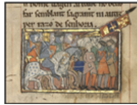
MS 0042P.36 - F.15