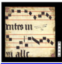
MARCADÉP.98 - F.R