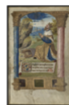
MS 0095P.79 - F.40