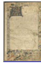
MS AA01P.41 - F.21

Les manuscrits médiévaux témoignent de pratiques musicales dans un contexte essentiellement religieux. En effet, au moins jusqu'au XVe siècle, la musique fut essentiellement portée par le chant, lui-même défini par la liturgie. Toutefois, les images ne manquent pas, tant dans la peinture que dans la sculpture, mettant en scène des musiciens en contexte profane et de divertissement (banquets, foires), voire irrévérencieux et subversif (charivari).