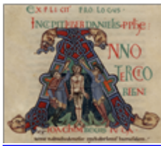
MS 0001-2P.111 - F.207

La fonction rythmique des percussions, les place également à un rang inférieur. Quelques exceptions dérogent à ce classement, à l'instar des trompes, de l'orgue et des cloches, dès lors que l'Eglise en a recours pour la liturgie, comme outil théorique ou lorsque l'un de ces instruments incarne l'intervention divine, la parole de Dieu.