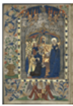
MS 0171P.2 - F.1