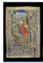
MARCADÉP.87 - F.V