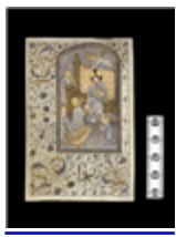
MARCADÉP.65F - F.R