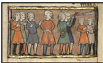
MS 0042P.88 - F.41