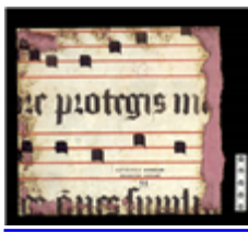
MARCADÉP.99 - F.R

D'un point de vue technique, l'invention de la ligne, au Xe siècle, fut une avancée fondamentale. Constituant un axe horizontal portant la musique, elle soumet désormais le texte au temps linéaire. Les lignes ne cesseront dès lors de s'étagger au gré des besoins de désignation visuelle des hauteurs sonores : les notes y prennent place de façon à figurer précisément leur hauteur. La portée de cinq lignes que nous connaissons aujourd'hui s'imposera seulement à l'époque moderne.