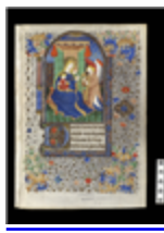
MARCADÉP.89 - F.R