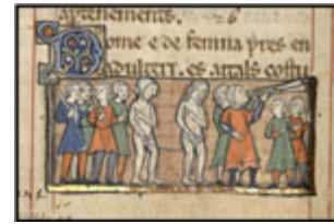
MS 0042P.84 - F.39