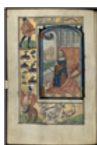
MS 0094P.134 - F.67