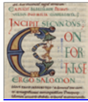
MS 0001-1P.279 - F.140